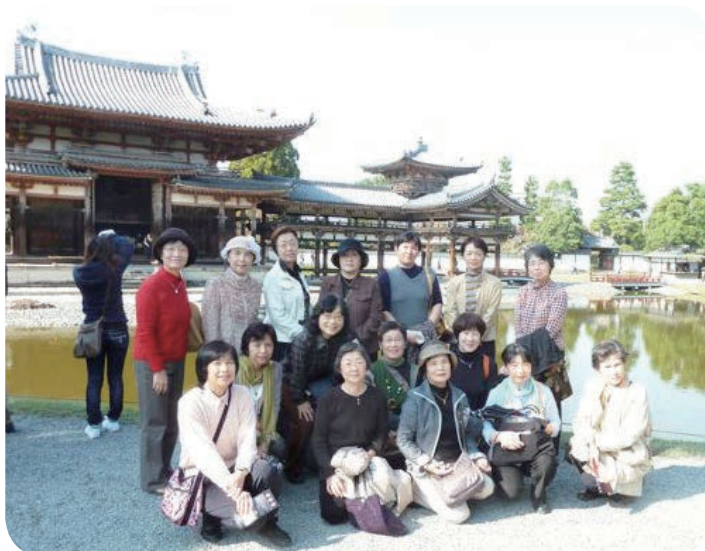
平成23年11月13日 宇治・平等院にて

芍薬会は毎年秋に、女性ばかりの会員が集まって、近畿一円の楽しい場所に集い、散策、昼食会、おしゃべりをする場です。第1回は平成15年10月奈良県大宇陀で22名参加し、森野旧薬園大願寺、薬草料理を楽しみました。