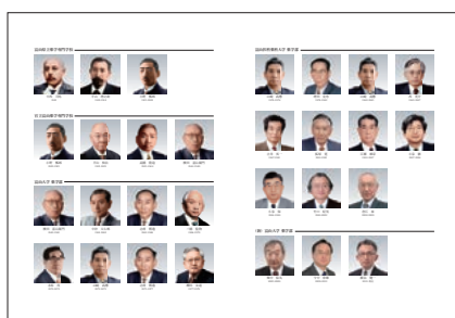
(写真2) 歴代校長ならびに薬学部長一覧