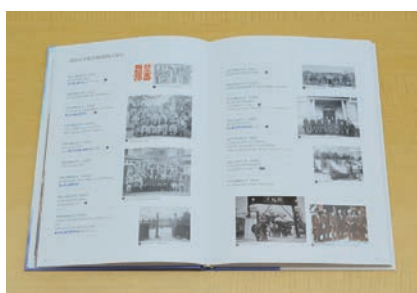
(写真1) 富山大学薬学部123年の歩み