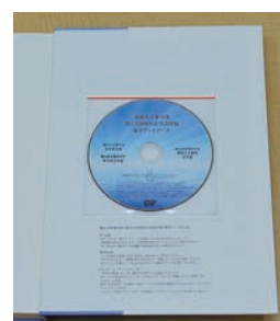
(写真3) DVD-ROMが巻末に貼付

発行部数：150冊 限定 価 格：1冊6,000円（送料込み） 申込み先：郵便振込み 口座番号：00790-6-108256 加入者名：国立大学法人富山大学募金口 締切り日：平成29年3月20日（振込み締切り日）